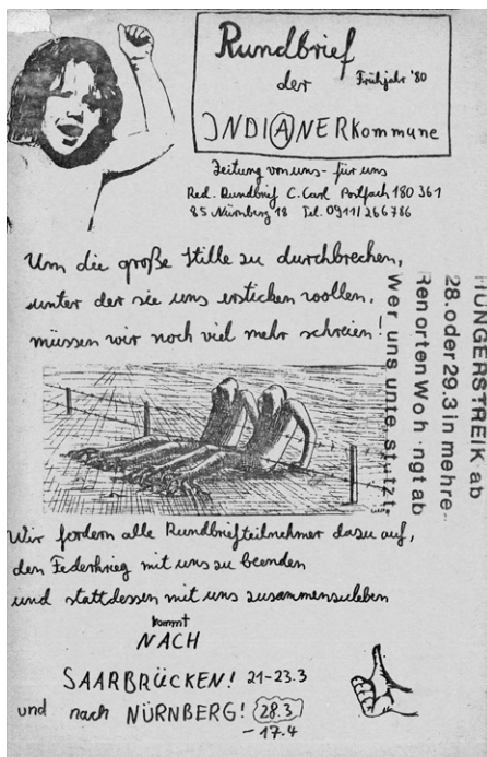
Abb. 1 Rundbrief der Indianerkommune , Frühjahr 1980, mit Verweisen auf die BDK der Grünen in Saarbrücken und Hungerstreikaktionen.

Eine Zeitung aus der Indianerkommune 38 abgelöst; dicht bedruckt und im Format A5 schwankte der Umfang zwischen 32 und 132 Seiten. 38