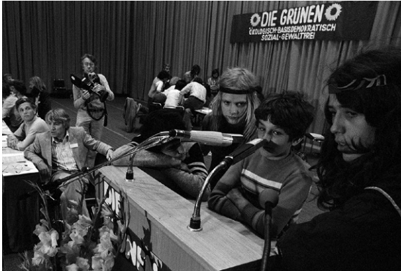
Abb. 3 Mitglieder der Indianerkommune bei der BDK der Grünen am 21./22.06.1980 in Dortmund.